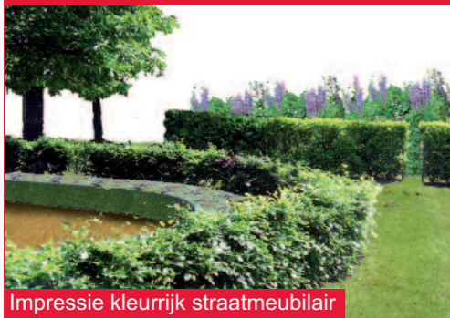
Impressie kleurrijk straatmeubilair