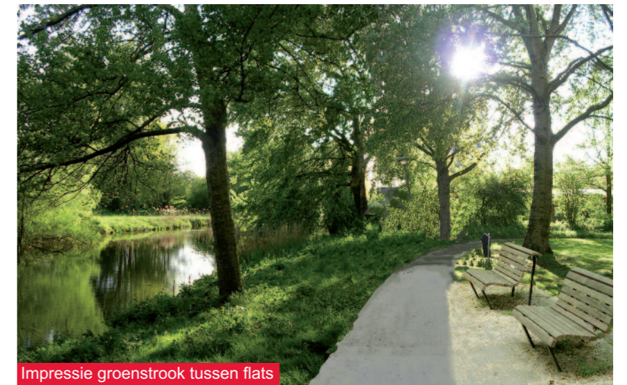
Impressie groenstrook tussen flats

De echte werkzaamheden starten naar verwachting begin maart. Te beginnen met het opschonen en 'vrij' maken van het werkkerrein. Oude beschoeiing wordt verwijderd. Bomen die blijven staan worden beschermd tegen mogelijke beschadigingen. Daarna volgt het grondwerk. Er worden deels natuurvriendelijke oevers gemaakt waardoor veel grond vrij komt. In het Heempark komt een vijver-vormige waterpartij aan de Europavaart. De vrijgekomen grond gaat naar het Engelandpark of het Reinaldapark. Sommige delen krijgen een nieuwe beschoeiing. De paden in het Heempark krijgen een nieuwe asfaltlaag en er wordt nog een extra wandelpad aangebracht zodat het park beter toegankelijk is. Vóór de aanplant van het groen wordt ook nieuw meubilair geplaatst zoals banken, prullenbakken én straatverlichting. Voor de liefhebbers komen er in de Europavaart afmeervoorzieningen voor enkele kleine bootjes. Deze voorzieningen komen op de koppen van de flats.