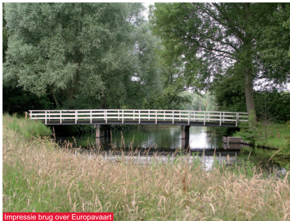
Impressie brug over Europavaart

De volgende stap is dat de uitvoering van het werk moet worden gegund aan de aannemer die voor de laagste prijs inschrijft. Na de gunning gaat de aannemer het werk voorbereiden. Hij moet materialen bestellen zodat hij daar tijdens de uitvoering efficiënt gebruik van kan maken. Vanwege de levertijden gaat hier enige tijd overheen.