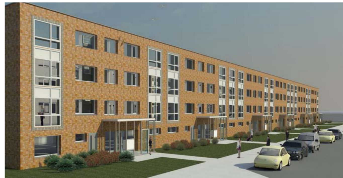
Het aangezicht van de toekomstige woonblokken aan de Engelandlaan

Begin 2012 wil woningcorporatie Ymere beginnen met de uitvoer van een aantal technische maatregelen in de drie blokken aan de Engelandlaan. Ook wil Ymere de uitstraling van de drie blokken verbeteren, de gevels en entrees worden daarom ook aangepakt.