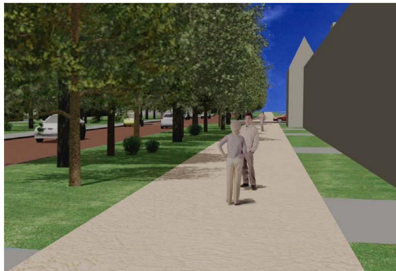
Een impressie van hoe de Laan van Angers eruit komt te zien.